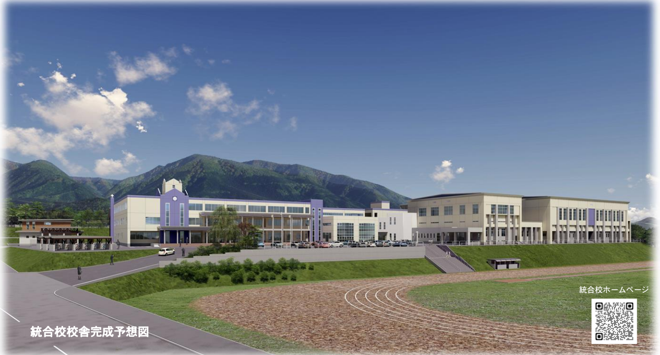
統合校校舎完成予想図

グローバル化の時代に対応できる広い視野と、持続可能な地域社会づくりへ参画しようとする高い志をもち、多様な人々と協働して未来を切り拓くたくましい人間の育成